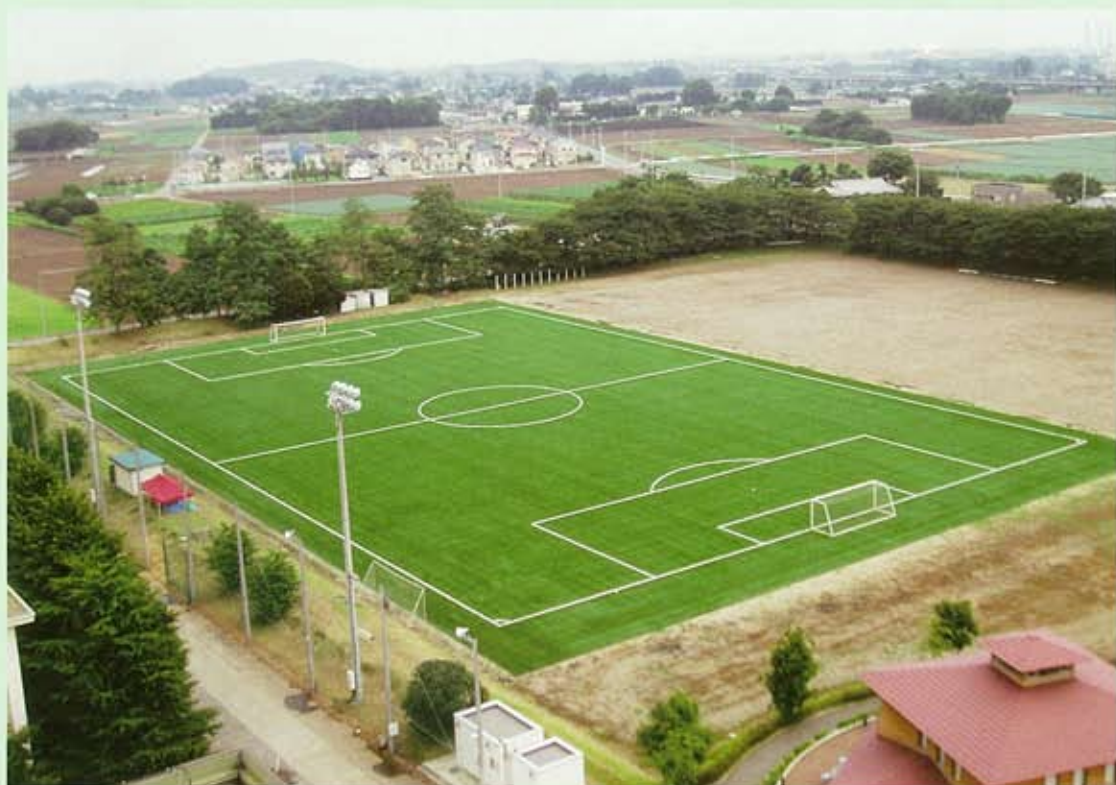
人工芝サッカーグラウンド